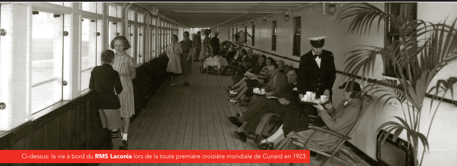
Ci-dessus: la vie à bord du RMS Laconia lors de la toute première croisière mondiale de Cunard en 1923.

Célébrez un siècle de voyages révolutionnaires avec Cunard, en l'honneur d'un anniversaire inoubliable dans l'histoire du voyage. En 2023, le Queen Victoria entreprendra un voyage mondial de 103 jours, commémorant le 100 e anniversaire du voyage inaugural de Cunard à travers le monde.