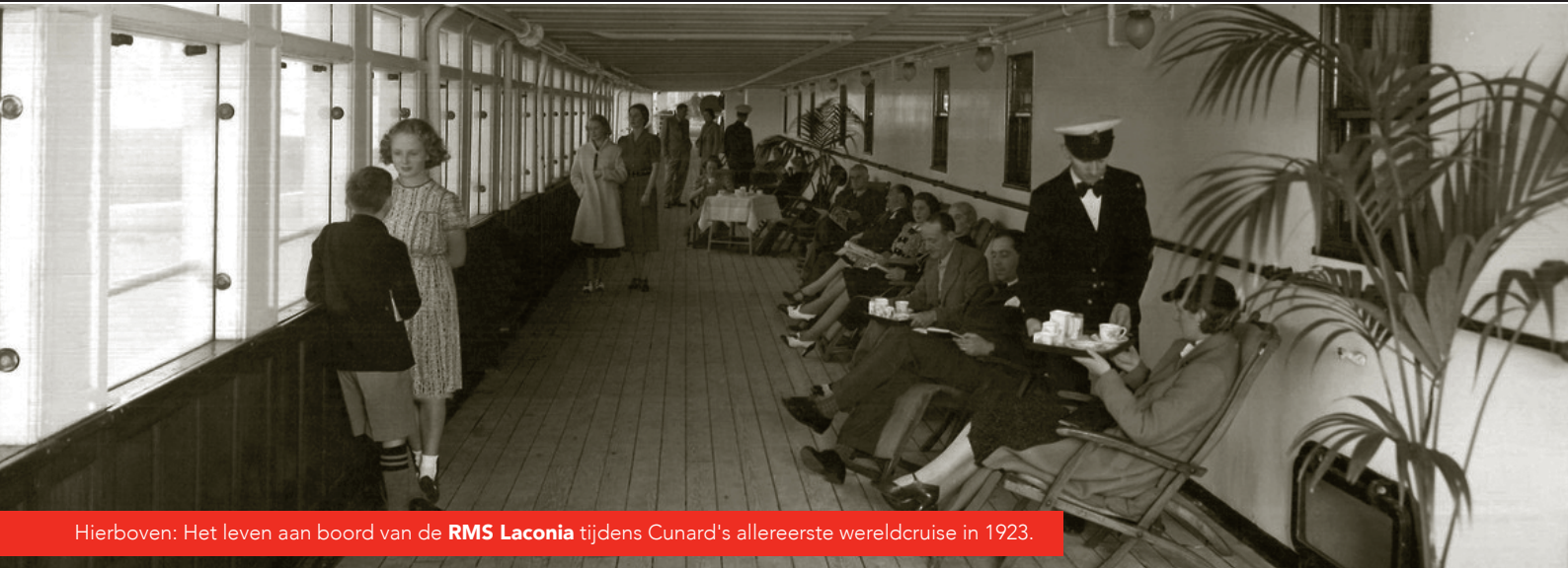
Hierboven: Het leven aan boord van de RMS Laconia tijdens Cunard's allereerste wereldcruise in 1923.

Vier samen met Cunard een eeuw van baanbrekende oceaandreizen, waarbij we een historisch jaar in de reisgeschiedenis eren. In 2023 maakt Queen Victoria een 103 dagen durende "Centenary World Voyage", waarbij we herdenken dat het 100 jaar geleden is sinds Cunard's eerste reis rond de wereld.